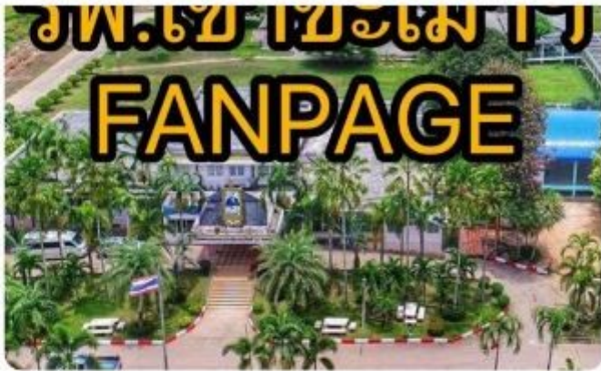
โรงพยาบาลเขาชะเมา เจลิมพระเกียรติ 80 พรรษา